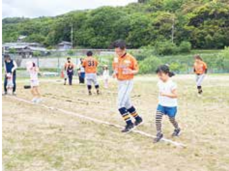
備前サンラッキーズのみなさんがマンツーマンで指導 してくれた走り方教室！みんな運動会で活躍できた？