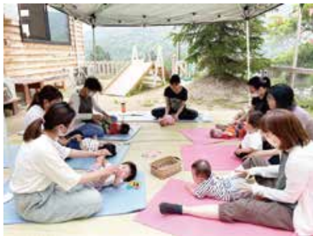
青空の下、親子ヨガでふれあったり、お部屋で交流したり。赤ちゃんがたくさん遊びに来てくれます♪