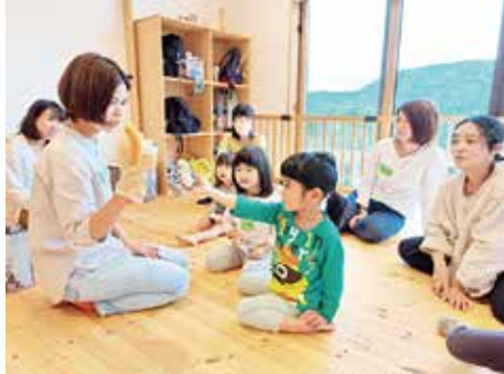
えいごであそぼう♪ 絵本やゲームを楽しみながら みんなで一緒に英語に親しんだよ！