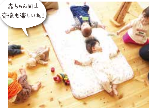
赤ちゃん同士 交流も楽しいね！