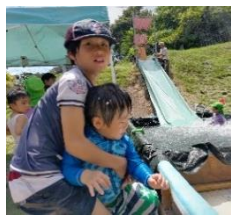
おにいちゃんの見守り