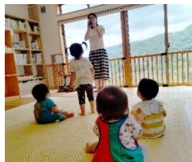
オカリナのおねえさん にきぎ付け→