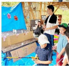
↑すいか割り ← 子どもたちと つくる緑日屋台