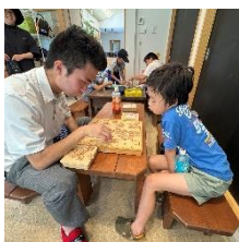
おにいちゃんと将棋