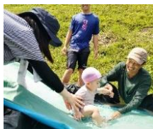
はじめてのスライダー