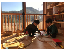
帰省中にも遊びに 来てくれたよ！

森の冒険ひみつ基地は 大きな自然と 温かいまなざしの中で 子どもたちが遊び育ち 子どもも大人も つながりあえる場を 目指しています