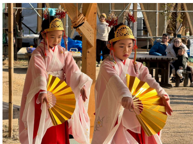
新春の舞 かわいい巫女様たちに祈りを託して…