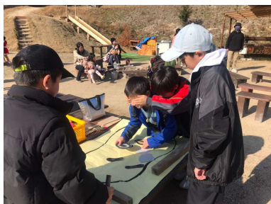
お正月あそびをしたよ！ 福笑い、はじめてのちようせん！！