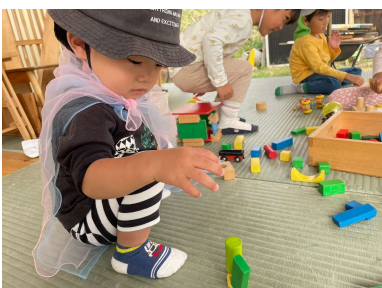
みんなの東屋では小さな子どもたちの んびり遊んでいます☆