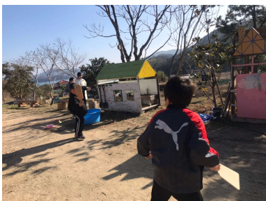
羽子板はむずかしいね！ 何度も何度もやってみました

森の冒険ひみつ基地は 大きな自然と 温かいまなざしの中で 子どもたちが遊び育ち 子どもも大人も つながりあえる場を 目指しています