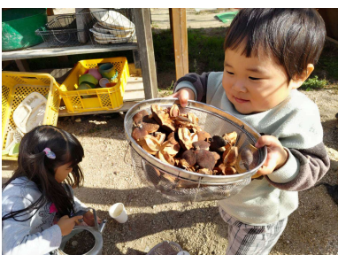
ツバキの実をたくさんあつめたよ～ 木の実の殻でクッキング！