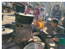
おみそ汁、たき火で つくるとおいしいね

森の冒険ひみつ基地は 大きな自然と 温かいまなざしの中で 子どもたちが遊び育ち 子どもも大人も つながりあえる場を 目指しています