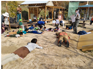
火災の避難訓練！服についた火の消し方 を消防署の方に教えてもらったよ☆