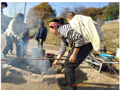
たき火の季節です♪ お母さんたちも火起こしがばっています

森の冒険ひみつ基地は 大きな自然と 温かいまなざしの中で 子どもたちが遊び育ち 子どもも大人も つながりあえる場を 目指しています