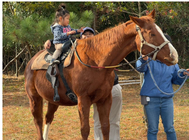
プレバにお馬さんがきてくれたよ 大きな背中に子どもたちもドキドキ