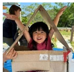
タンボールをたくさん出している日もあるよ