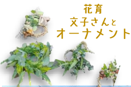
花育 文子さんと オーナメント