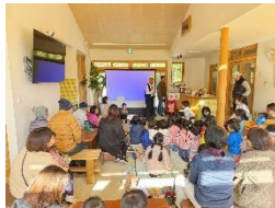
大型スクリーンで紙芝居 歌って笑って幸せな時間！