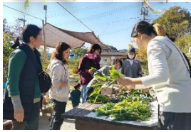
お母さんたちの創作タイム！