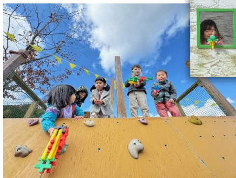
ブロックでつくった「ぶき」をもってみんなでチカラを合わせて「わるもの」とたたかいごっこ