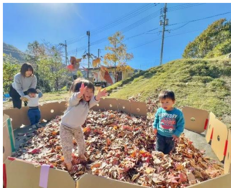
赤や黄色、茶色の落ち葉がいっぱい！ プレバに落ち葉を集めて、カサカサ、みんなであそんだよ